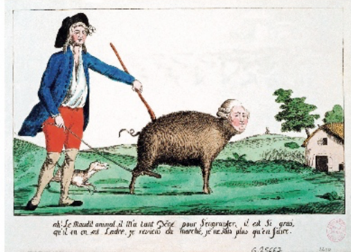
« Ah ! le maudit animal », gravure anonyme, vers 1791.

« Ah ! le maudit animal », gravure anonyme, vers 1791. « Il m'a tant péné [sic] pour s'engraisser. Il est si gros et gras qu'il en est ladre [insensible aux coups]. Je reviens du marché, je ne sais plus qu'en faire. »