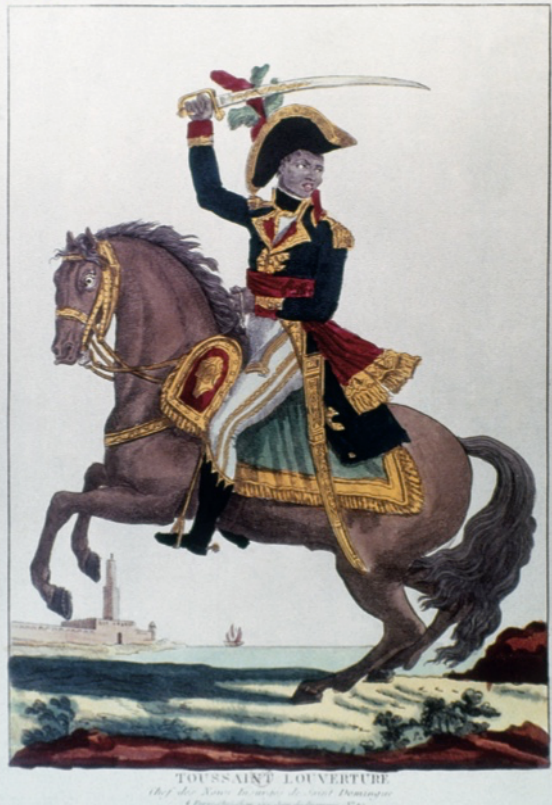
Toussaint Louverture (gravure), fin XVIII e siècle.

Citoyen Consul, Votre lettre m'a été transmise par le citoyen Leclerc, votre beau-frère, que vous avez nommé capitaine général de cette île : titre qui n'est point reconnu par la Constitution de Saint-Domingue. [...] Saint-Domingue, cette colonie, qui fait partie intégrante de la République française, aspire, dit-on, à l'indépendance. Pourquoi non ? Les États-Unis d'Amérique ont fait comme nous ; et avec l'assistance du gouvernement français, ils ont réussi à consolider leur liberté. [...] J'ai étouffé la sédition, apaisé la révolte, rétabli la tranquillité ; j'ai fait succéder le bon ordre à l'anarchie ; enfin, j'ai donné au peuple la paix et une Constitution. [...]