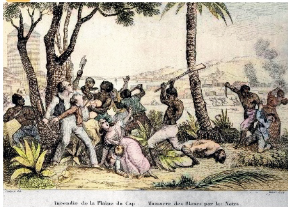
Détail d'une gravure allemande, 1791.