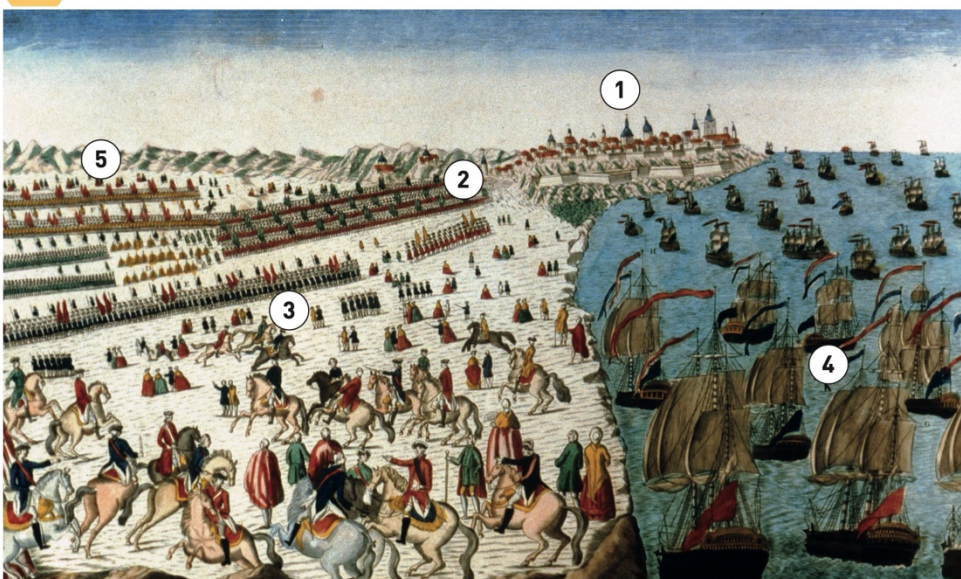
Gravure colorée d'époque. Les armées française et américaine commandées par Rochambeau et Washington remportent, sur terre et sur mer, cette bataille décisive pour l'indépendance.