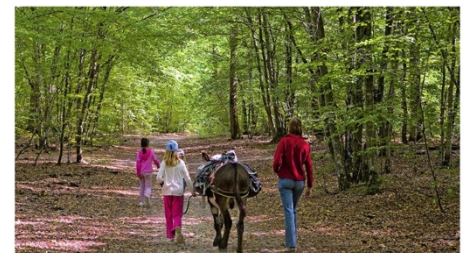
2 Les usages récréatifs de la forêt périurbaine : la forêt de Fontainebleau

Les principaux syndicats [...] accusent l'établissement "d'industrialiser la forêt". Comprendre : en faire une activité purement économique allant à l'encontre de l'ensemble des missions et de la préservation du patrimoine. [...]