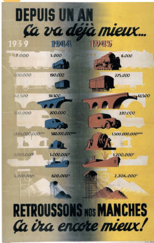
Affiche d'octobre 1945, Havas.